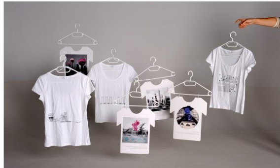
PERIPHERY OF THE IDYLL