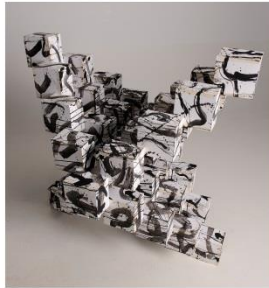
PERIPHERY OF THE IDYLL