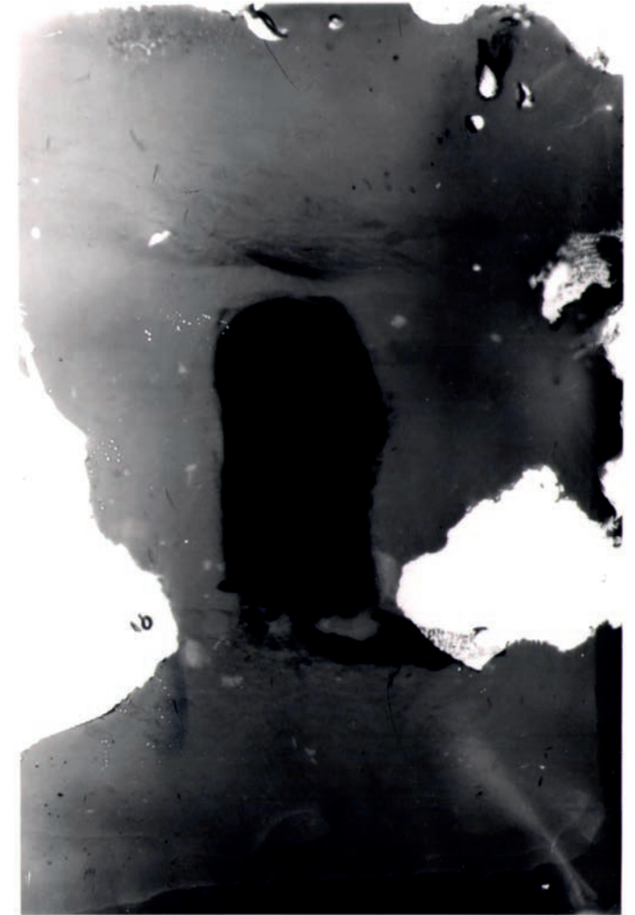
Seelen, 1998, Silbergelatine auf Papier, 120 x 90 cm