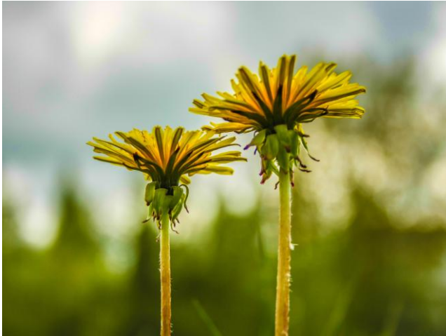
MV wächst und wächst